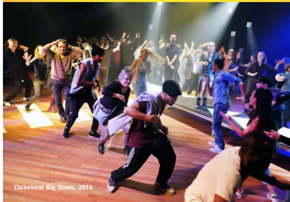
Clubevent Big Town, 2016