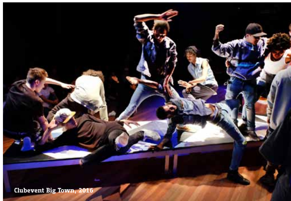
Clubevent Big Town, 2016

Rondom zijn activiteiten plaatst Don't Hit Mama een reflectief en analytisch programma, bedoeld om de eigen geschiedenis, werkwijze en de ontwikkelde dans- en maakcultuur te verslaan en uit te dragen. Dit zal onder meer leiden tot een reeks publicaties, lezingen, lessen en workshops. Waarmee we ook aanbod leveren voor het kunstvakonderwijs. Dit verstevigt de theoretische basis van deze nieuwe danscultuur - de future dance aesthetics - waaraan we al jaren werken.