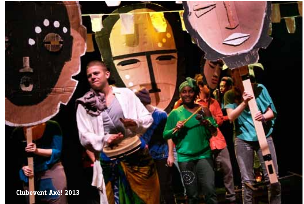
Clubevent Axé! 2013

2019, Europese samenscholing: East London Dance (UK), Zinnema (Brussel), mogelijke Duitse partner . Een Europese uitwisseling rondom talentontwikkeling van jonge dansers. De Contacten met Engeland en België lopen al, komende jaren ontwikkelen we dit project met onder meer gezamenlijke trainingen, uitwisseling van werkvormen en afsluitende presentaties, in East London Dance en in Nederland, in 2019.