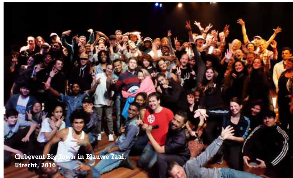
Clubevent Big Town in Blauwe Zaal, Utrecht, 2016

Don't Hit Mama levert als ontwikkel-instelling nieuwe danstalenten, een nieuwe generatie dansmakers en zijn onderzoek levert voeding voor grensverleggende kunst die wezenlijke vragen stelt en danst. Een ambitie die vraagt om een passende, financiële en organisatorische jas.