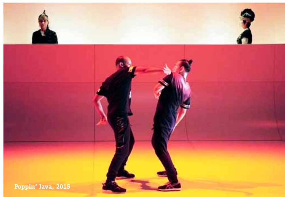
Poppin' Java, 2015

Voor het ontwikkelen van dit platform zoeken we extern advies; In samenspraak met collega's en andere ontwikkel-instellingen ontwikkelen we in 2017 het concept. We presenteren het nieuwe platform in seizoen 2017 / 2018.