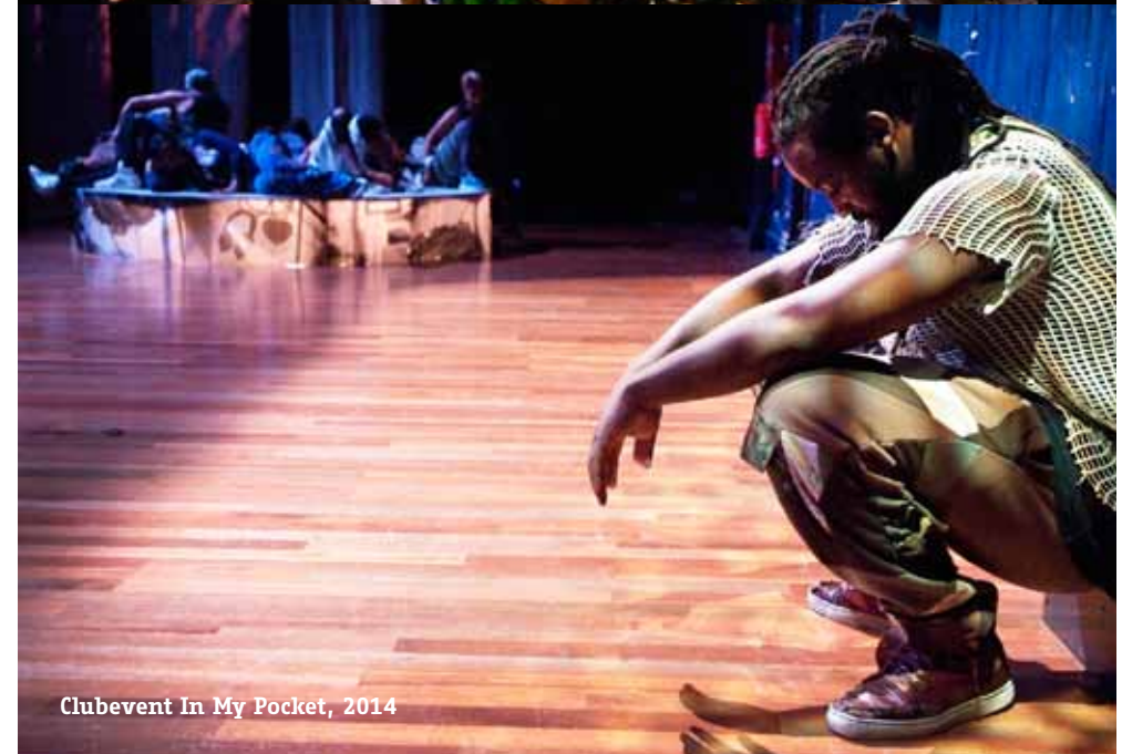
Clubevent In My Pocket, 2014